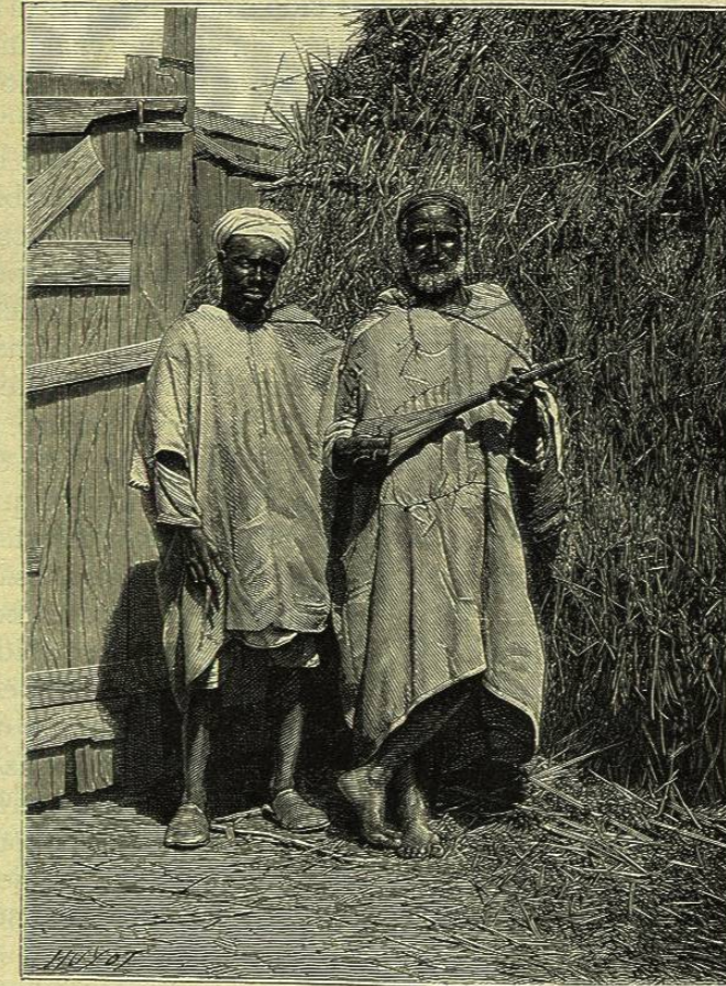
Mendigos marroquíes. — De fotografía

pues fuera de la religión nada ha cambiado en ellos; y no sólo continúan tales como podemos representárnoslos por medio de las descripciones de Herodoto, ó de las relaciones de la Biblia, sino que están condenados á no cambiar. Si regiones fértiles como las del Yemen crean poblaciones sedentarias y agrícolas, los áridos arenales del desierto no pueden crear más que nómadas.