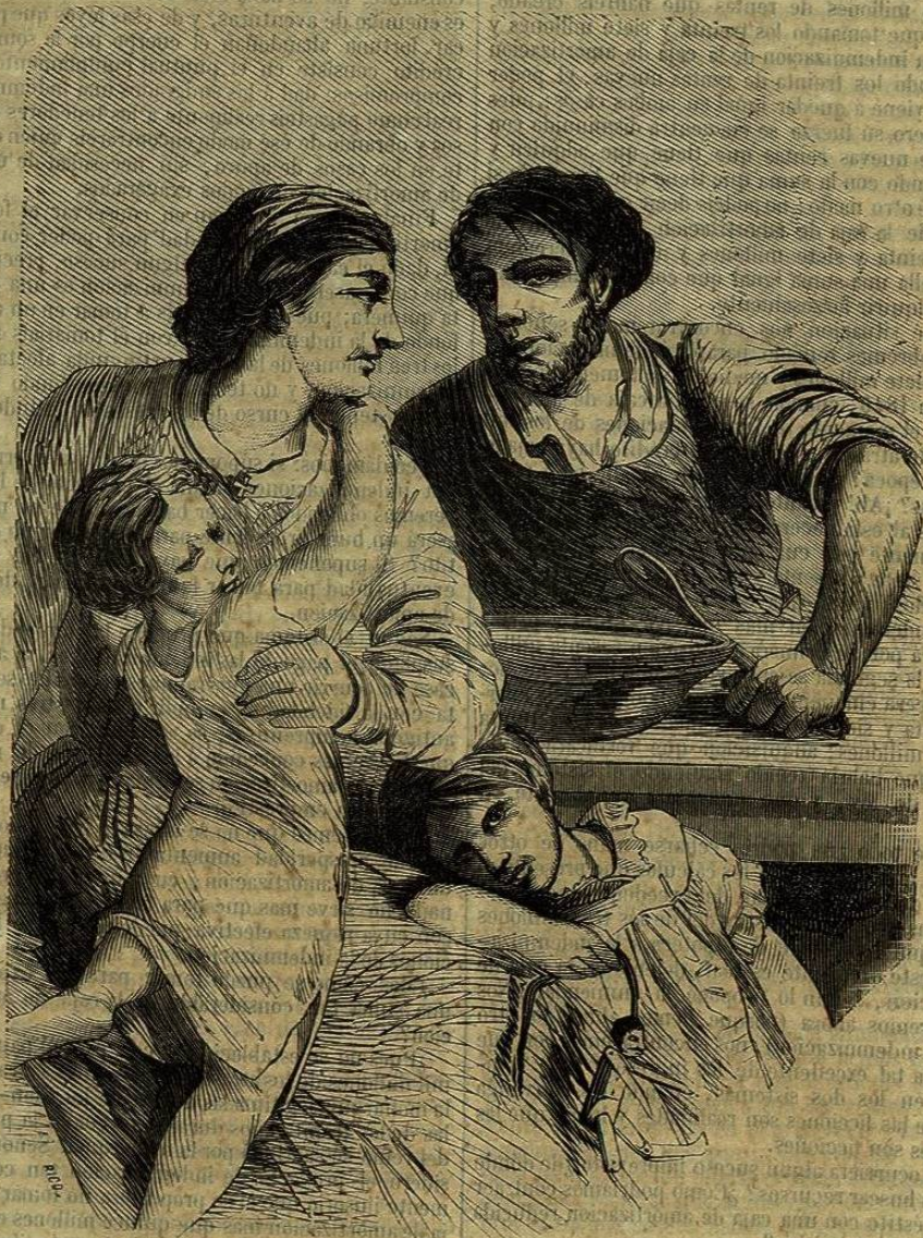
UNA FAMILIA ARTESANA.

Temeis conmovier el crédito, tocando la caja de