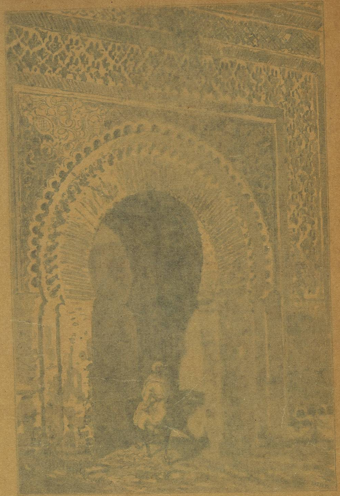
Las puerta de Mezquita

Esta traducción es propiedad de Espasa y Comp. ª , Editores. Queda hecho el depósito que marca la ley.