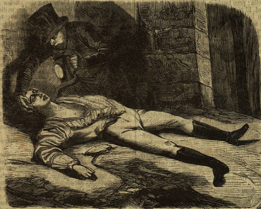
MUERTE DE ENGHEN.

Bonaparte ha demostrado demasiada mediocridad en el infortunio para que se pueda creer que su elevacion fue obra del genio; su elevacion es hija del poder de la Francia, y la Francia la consideró como hija de los hechos de aquel hombre. Su grandeza es el resultado de las inmensas fuerzas que pusimos en sus manos en el momento de su elevacion. La heredó de los ejércitos, formados por los mas hábiles generales de la Francia, conducidos tantas veces á la victoria por aquellos grandes capitanes que han perecido, y que sin quedar uno peroceran acaso víctimas de los furo-