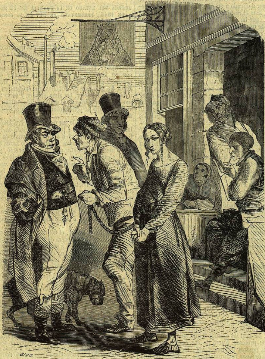
UN INGLÉS VENDIÉNDO A SU MUJER.

Estos repentinos trastornos son asaz comunes en todos los pueblos que han tenido la espantosa desgracia de caer en manos del despotismo militar. Llenas están de ellos la historia del Bajo imperio, la del imperio otomano, la del Egipto moderno, y la de las regencias de Berbería. A cada momento en el Cairo,