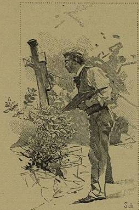
... Le premier comique mettait les noms sur les croix de bois...

Le jeune premier, fort deuxième, comparait un verre d'eau-de-vie avec un autre, faisait le saut périlleux du