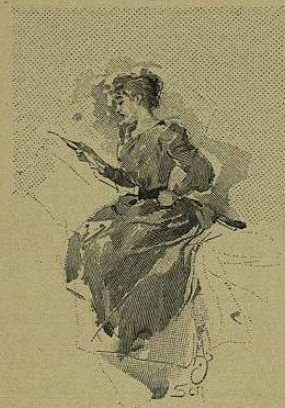
... La première lettre portait le timbre de Bor- deaux...

« Enfoncé le guignon, ma petite ! « Qu'est-ce que j'ai fait depuis que « j'ai quitté cette sale baraque de « théâtre de Bordeaux ? J'ai fait for- « tune, mon ange ! Je suis aux Fo- « lies-Dramatiques. Je tutoie des vau- « devillistes, des millions, et les plus « jolis garçons de la terre. Je vis le « matin, je vis la nuit, je vis tou- « jours. J'ai des amants, des caprices, « des pièces, des meubles, des dettes, « du crédit et cent mille francs de « volants ! Je suis drôle, j'ai de l'es- « prit, j'épate ! je fais la gaieté ! on « me jette des vers, des bouquets, « des cœurs, des truffes, et les « miettes du Régent ! Je connais la « moitié du boulevard, et l'autre moi- « tié me salue. Je fais mon trou, « mon nom, et mon beurre ! J'ai « mis les écrevisses bordelaises à la