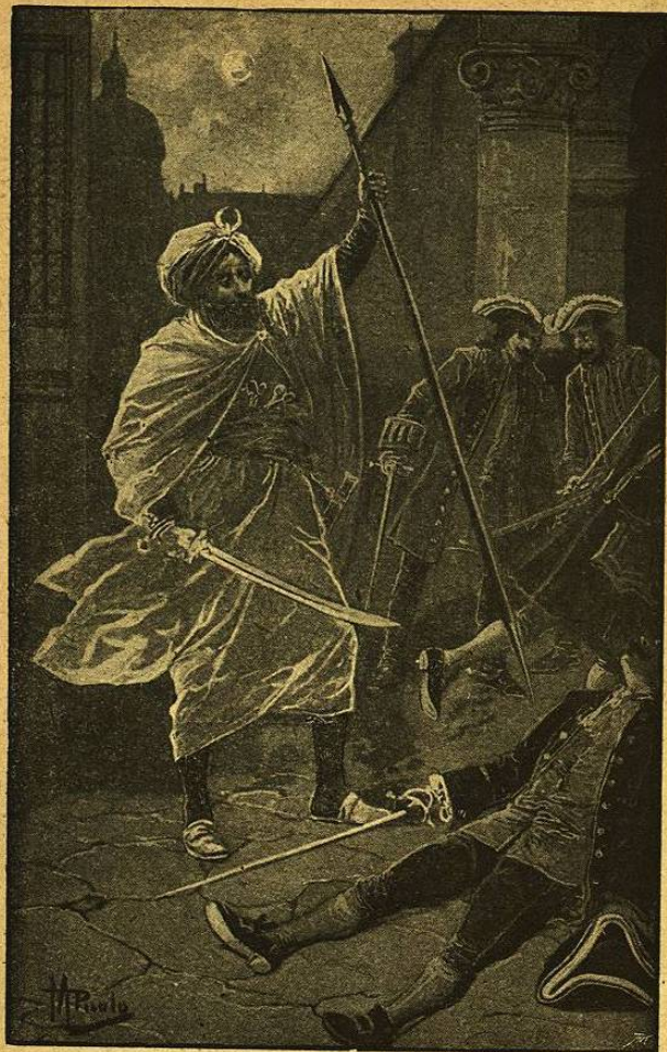
Salió bruscamente una forma blanca...