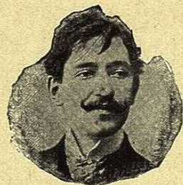
ENRIQUE GÓMEZ CARRILLO

Imp. calle Valencia, 275 y 277.—Barcelona.