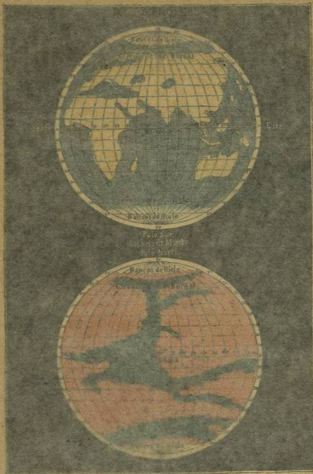
ASPECTOS COMPARADOS DE LA TIERRA Y DE MARTE.

Diámetro de la Tierra igual a 1,282 leguas. Radio de Marte igual a 327 leguas.