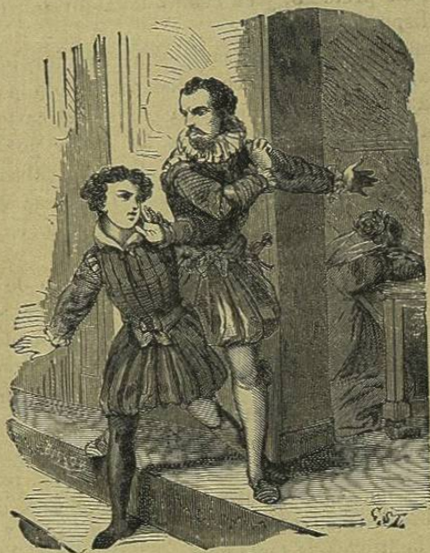
El paje fué echado de la casa.

zos por una y otra parte, la carta quedó en manos de la dueña, y de alli pasó á las del Principe. No es posible describir el terror de Gertrúdis al oír los pasos de su padre, de un padre como aquel, sobre todo, irritado, y ademias conociéndose ella misma culpada. Pero cuando le vió con aquel ceño y con la carta en la mano, hubiera querido estar no sólo en