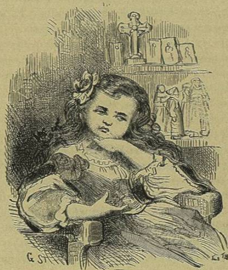
Era esta la hija menor del principe de "".

— Dejémonos de cumplimientos; yo tambien, en caso de necesitarlo, me valdria del favor de los padres capuchinos;