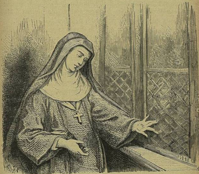
Su aspecto representaba una mujer de unos veinticinco años.

Llegado el padre Guardian á la puerta de la poblacion, flanqueada en aquel tiempo por un torreón antiguo, y un trozo de castillo derribado, que quizá más de diez de mis lectores se acordarán haber visto casi entero, se paró volviendo la cabeza por ver si le seguían : entró despues, y se dirigió al convento. Así que llegó, se paró de nuevo en el umbral, aguardando á las viajeras. Rogó al carretero que diese una