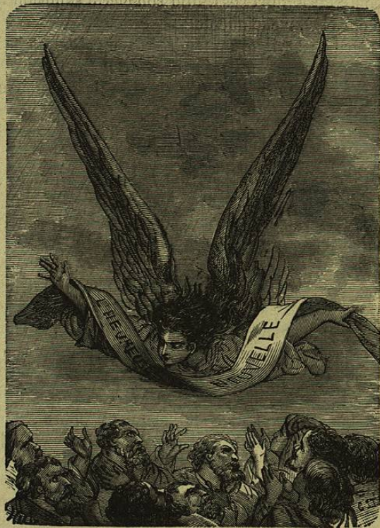
¿Cuál es la buena noticia que anunciáis á los pobres?

digo? ¡Oh ignominia! El mundo mismo la desecha: tambien él establece sus leyes, que señalan el bien y el mal: tiene él igualmente su Evangelio, un Evangelio de orgullo y de odio, y no permite que se diga que el amor de la vida es una razon