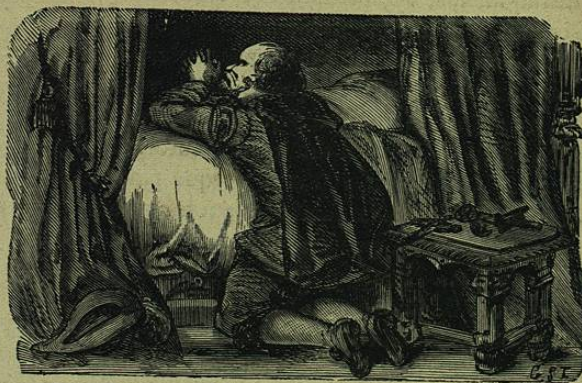
Aquel tirano tan famoso mudó enteramente de vida.

esta historia. ¿ Y quién sabe si algun curioso que tuviese habilidad y deseo de hallarla, encontraria en aquel valle alguna