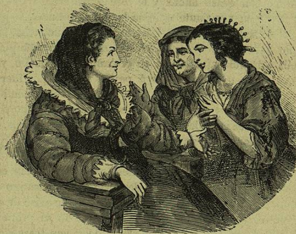
Llegadas ambas á la presencia de doña Práxedes, las acogió esta con felicitaciones.

Llegadas ambas á la presencia de doña Práxedes, las acogió esta con felicitaciones y muestras de aprecio y cariño, preguntó, aconsejó, y todo con cierta superioridad innata, templada con tantas expresiones humildes, tantas ofertas, tantas apariencias de devocion, que Ines al momento, y poco despues Lucía comenzaron á sentirse aliviadas de aquel respeto