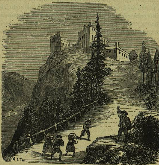
Él entretanto estaba dentro y fuera del castillo, arriba, abajo.

amigos y defensores. Dispuso luégo que se bajasen de un desvan todas las armas blancas y de fuego que de largo tiempo se hallaban allí amontonadas, y se las distribuyó entre todos. Mandó decir á sus dependientes y colonos del vall que todos los que quisiesen armas para defenderse fuesen al cas-