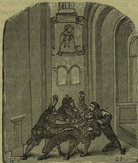
En la iglesia de San Antonio.

Dos ejemplos refiere Ripamonti, advirtiendo haberlos esco-