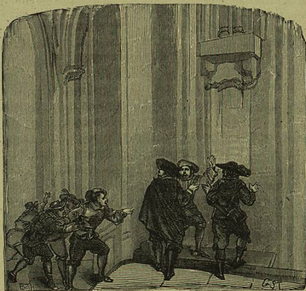
El frenesí se habia propagado lo mismo que el contagio.

El ayuntamiento entretanto, no desalentado por la negativa del sabio Arzobispo, repitió sus instancias, que el público tumultuosamente apoyaba. Persistió todavia algun tiempo el Arzobispo, procurando disuadir de aquel intento á las gentes, y esto fué todo lo que pudo hacer el buen sentido de aquel ilustre varon contra la razon de los tiempos y la insistencia de muchos. Atendido el estado de las opiniones de en-