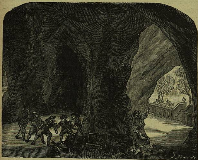
Últimamente, le enseñaron grandísimos cajones de dinero.

palacio, encontró amenidad y horrores, desiertos y jardines, calabozos y magníficos salones, y en ellos fantasmas sentadas en conferencia. Últimamente, le enseñaron grandísimos cajones de dinero, diciéndole que tomase la porcion que apeteciese, y al mismo tiempo si queria admitir un bote de unguento para ir untando por la ciudad, á lo que habiéndose