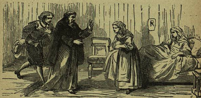
Le bendigo por haberme dado la facultad de hablar en su nombre.

— Entrégate con toda seguridad, y en paz, — prosiguió diciendo el Capuchino, — á los pensamientos de ántes. Pídele de nuevo al Señor las gracias que le pedias para ser