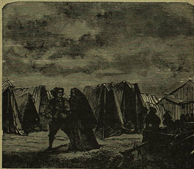
Y sin más echaron á andar entrambos.

pobre muchacha ; pero algunas veces es algo tenaz en sus aprensiones. Despues de tantas promesas, despues de todo lo que usted sabe, ahora dice, ¿ qué sé yo ? que en aquella noche del miedo se le calentó la cabeza, y en cierto modo se consagró á la Virgen ; cosa inútil, ¿ no es verdad ? Cosas muy buenas para los que saben lo que se hacen ; pero para