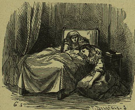
Lucía se dejó caer al lado de su cama.

— En caridad, Lorenzo, en caridad de Dios, acaba de una