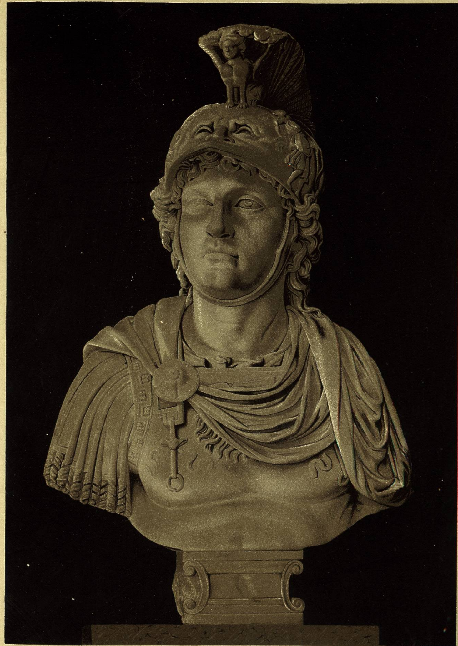
BUSTO DE ALEJANDRO EL GRANDE. que se conserva en la casa llamada de Pilatos en Sevilla

Faint, illegible text at the bottom of the left page, likely bleed-through from the reverse side of the leaf.