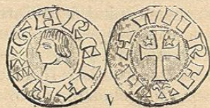
GARCÍA III DE NAVARRA

Pero el joven y activo rey de Navarra, que deseaba ya sacudir el yugo del emperador á que antes se había sometido, comprendió de cuánto provecho podía serle para su intento la alianza y amistad con un príncipe tan resuelto y belicoso como Alfonso Enriquez, y con un pueblo tan amante de su independencia como el portugués. Aliáronse, pues, el portu-