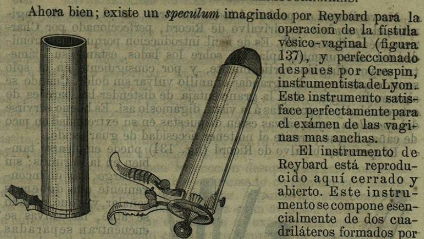
Fig. 135.—Espéculum lleno.