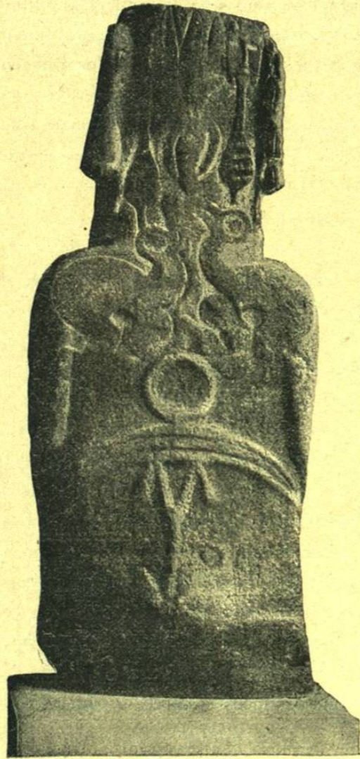
ESTATUA COLOSAL PREHISTÓRICA DE LA ISLA DE LA PASCUA (OCCEANÍA)

Las dunas de Iguidi en el Sahara occidental, son también cuidadosamente evitadas por las caravanas, y el Djouf, ó «Ventre del desierto», al noroeste de Timbuctu, es una depresión, tal vez salina, que defienden