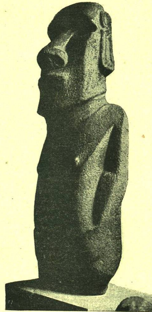
ESTATUA COLOSAL PREHISTÓRICA DE LA ISLA DE PASCUAS (OCCEANÍA) (Perfil)

Estos grupos de indígenas, de gentes «nacidas de la tierra», habitan