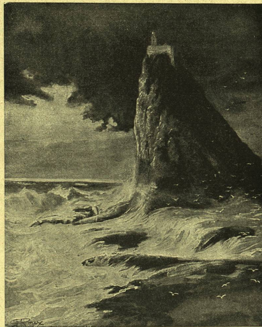
FARO DE LA ISLA DE UNST, EL PUNTO MÁS AL NORTE DE LAS ISLAS SHETLAND

Dibujo de G. Roux, según una fotografía.