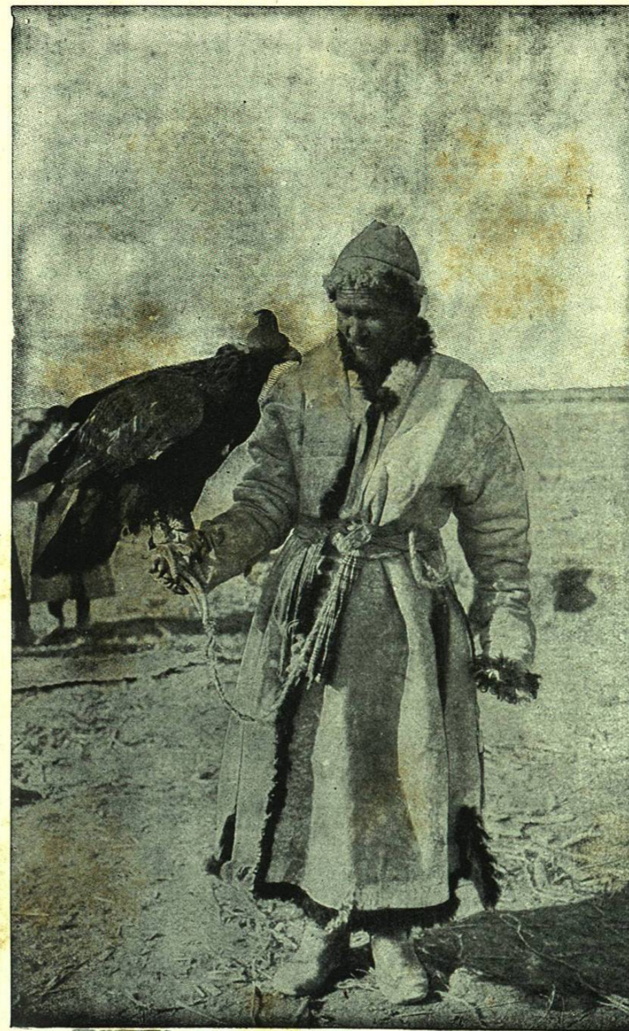
FALCONERO DE BEG D'ARRAT (TIBET)

Pero el hombre sano de la sociedad salvaje, cazador, pescador ó pastor, gusta de encontrarse con sus compañeros. El cuidado de su labor le obliga con frecuencia á acechar solitariamente la caza, á perseguir el pescado en un estrecho esquife batido por las olas, á alejarse del