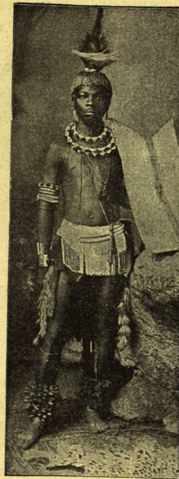
UN CAFRE Y SUS ADORNOS