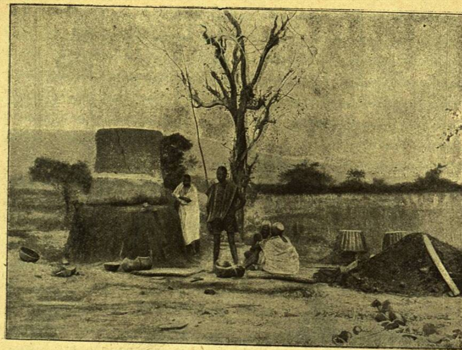
HERREROS NEGROS DEL SENEGAL.