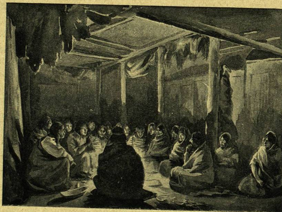
EL GRAN CONSEJO DE LAS MUJERES ENTRE LOS WYANDOT

Dibujo de Georges Roux según una fotografía.