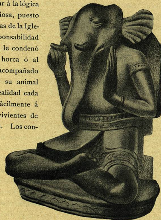
GANESA, EL ELEFANTE, TIPO DE LA SABIDURÍA

Del mismo modo, los Peruanos, hijos de los Quichúas y de los Aymaras, que fueron ellos mismos adoradores del Sol, han conservado mucho de su antiguo culto para imaginarse que las llamas, sus animales de carga, no dejan nunca, á la salida del astro, de volverse hacia él y de saludarle con ligeros balidos. Demasiado tímidos para atreverse, á pesar de sus sacerdotes venidos de ultramar, á prosternarse ante el orbe sublime que de repente abrillanta los montes, los Andinos