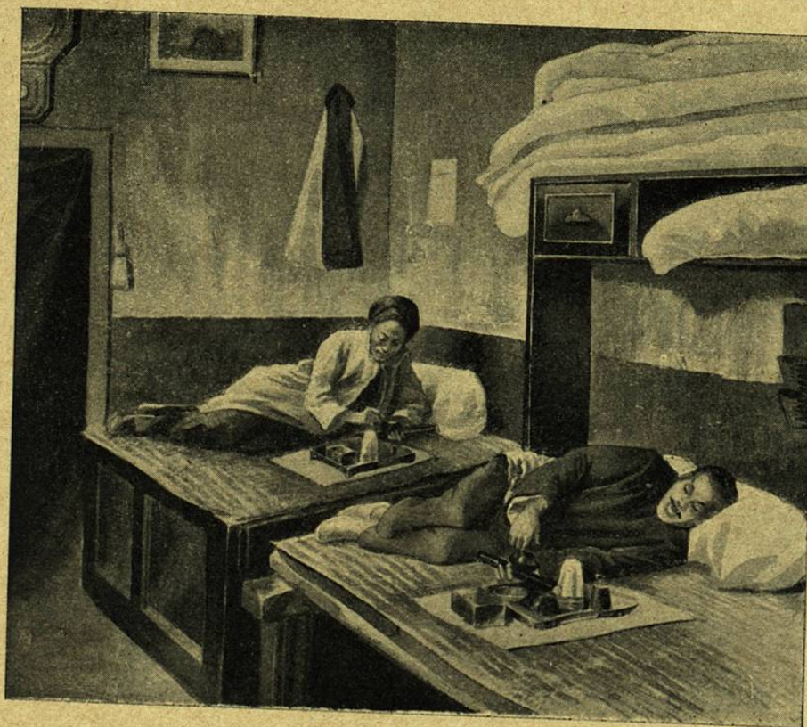
UN FUMADERO DE OPIO

Miles de religiones han alcanzado bastante importancia para constituirse en corporaciones con sus oficiantes, sus sacerdotes; algunas tienen hasta sus semidioses ó sus dioses visibles, cuyas palabras, ademanes y hasta las acciones más insignificantes reemplazan los razonamientos del