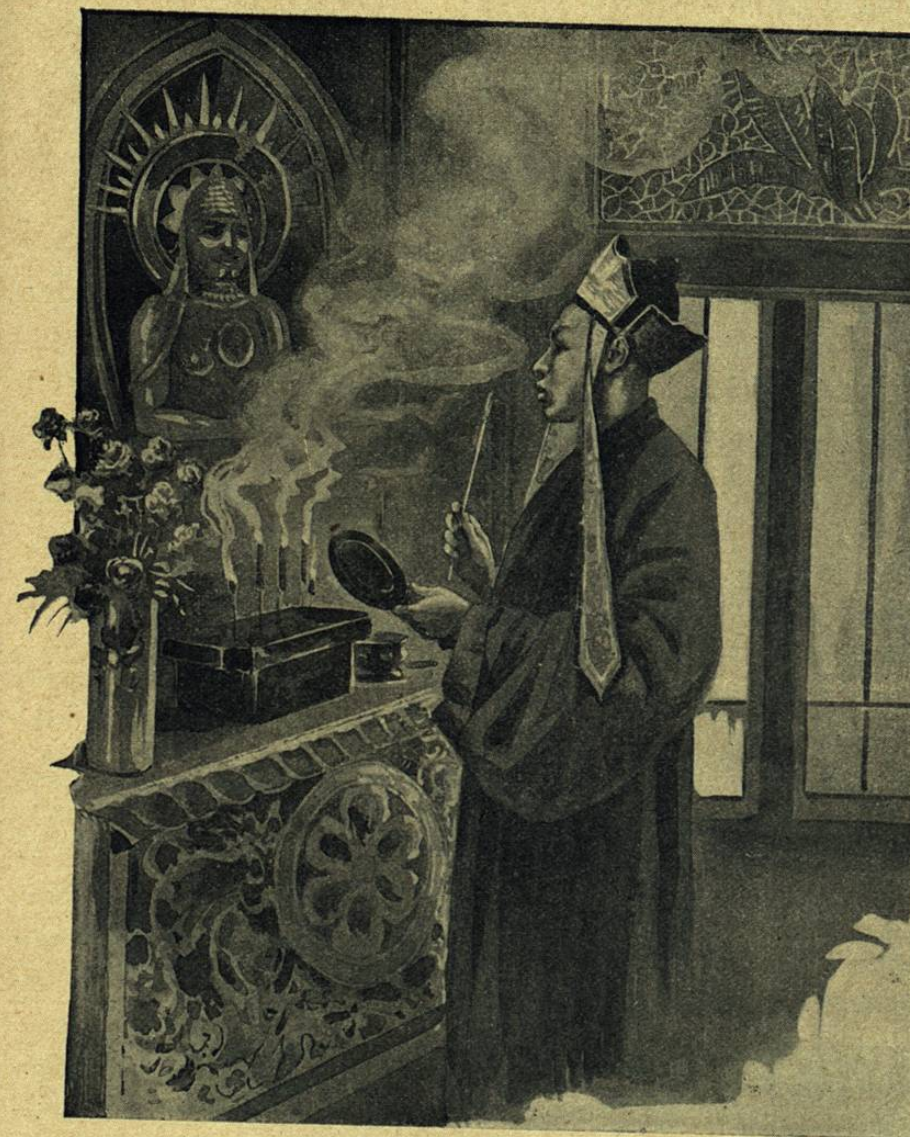
UN CLÉRIGO TAOISTA.—CONSAGRACIÓN DE UN ÍDOLO Dibujo de G. Roux según documentos del Museo Guimet.

Los mil accidentes de la vida diaria son en su mayor parte de una génesis difícil de comprender: como el conocimiento de los fenómenos no se ha revelado aún más que en nuestro muy próximo horizonte, y, sin embargo, la necesidad de explicarse todo obra necesariamente bajo una forma á lo menos rudimentaria, el hombre primitivo se siente naturalmente inclinado á buscar en los objetos que le circundan las causas mis-