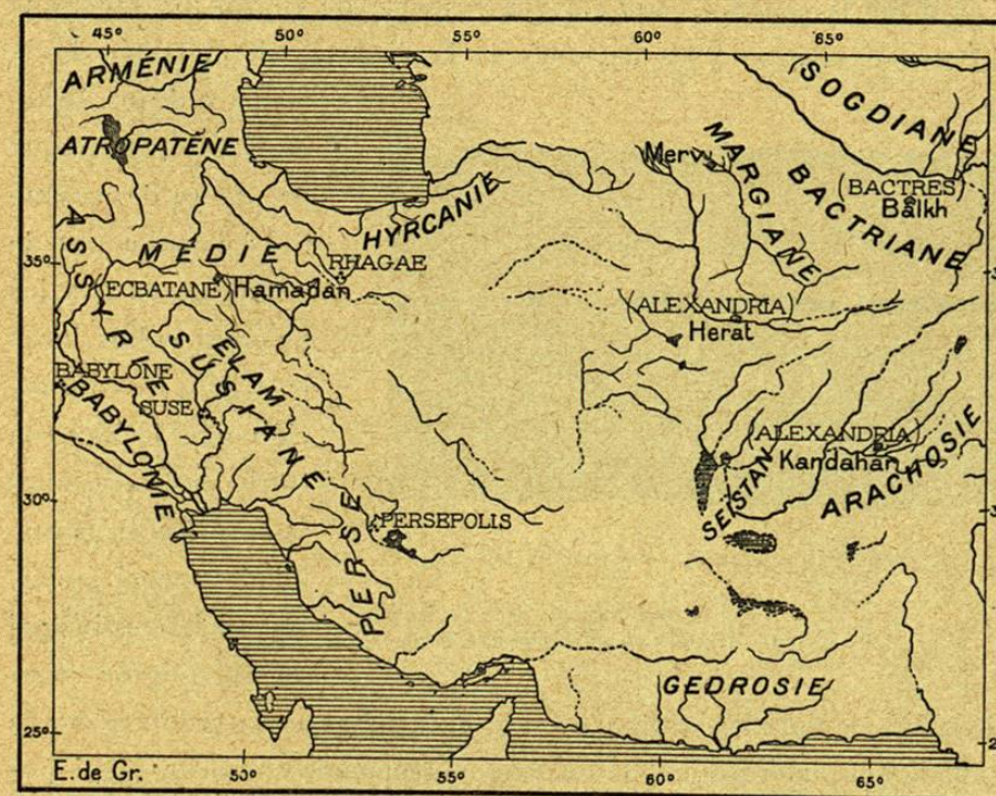
N.º 67. Imperios y Centros.

rodea de una zona ondulante que ha de proteger por medio de una muralla de piedra para detener las dunas. Tales son las condiciones que simbolizan los personajes épicos de Rustem el Iranio y de Afrasiab el Turanio, de Feridun el rey bueno y de Zohak el tirano, en cuyas espaldas se yerguen serpientes ávidas de cerebros humanos.