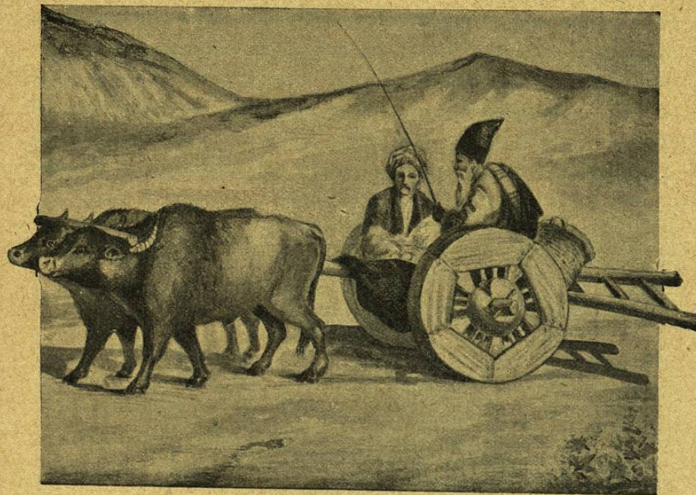
CARRETA DE LABRADOR EN KNOSROVAH

Dibujo de G. Dambuyant, de una fotografía.