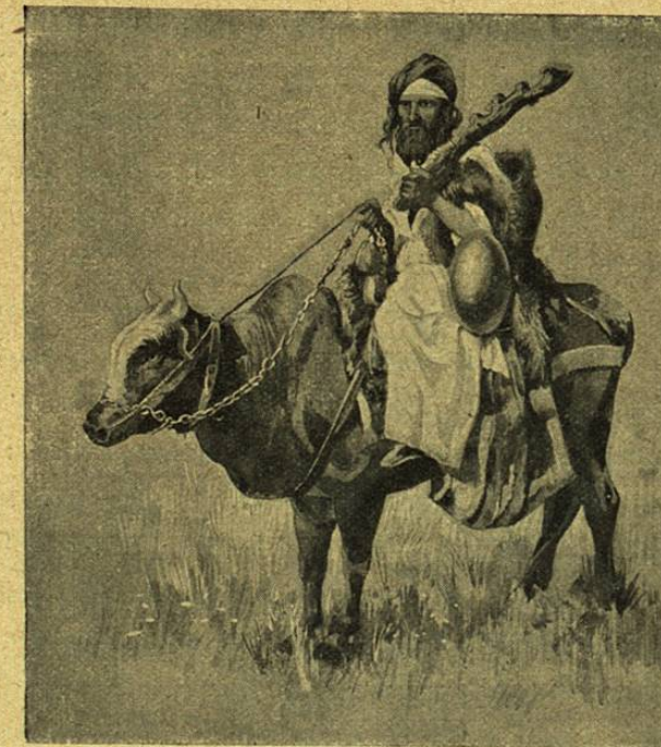
MENDIGO VIAJERO (PERSIA)

Á esas creencias de los iránicos primitivos, que se descubren de una manera muy clara en el Avesta y en los otros libros litúrgicos de Persia, se mezclaron naturalmente todas las religiones del naturismo y del animismo: admiración del cielo y de las nubes; veneración del agua vivificante, que brota de la roca y que se agotará pronto al sol si no se oculta en canales subterráneos; temor de los malos genios