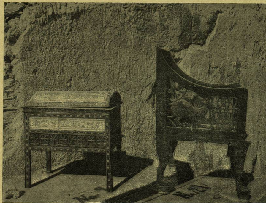
COFRE Y SILLÓN DE LA REINA TIA, ESPOSA DE AMENHOTEP IV