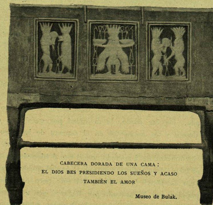
CABECERA DORADA DE UNA CAMA: EL DIOS BES PRESIDENDO LOS SUEÑOS Y ACASO TAMBIÉN EL AMOR

el pueblo que sufre y el temible destino habían de interponerse los sacerdotes. Una roca de la isla de Elefantina, en frente de Assuan, tiene una curiosísima inscripción de la época griega, redactada por escribas religiosos como la reproducción real de una plegaria que hubiera proferido un rey de la tercera dinastía, es decir, de los tiempos viejos en aquella época, quizá de cinco mil años. Según el texto de la inscripción, ese personaje se dirige al dios de la catarata para