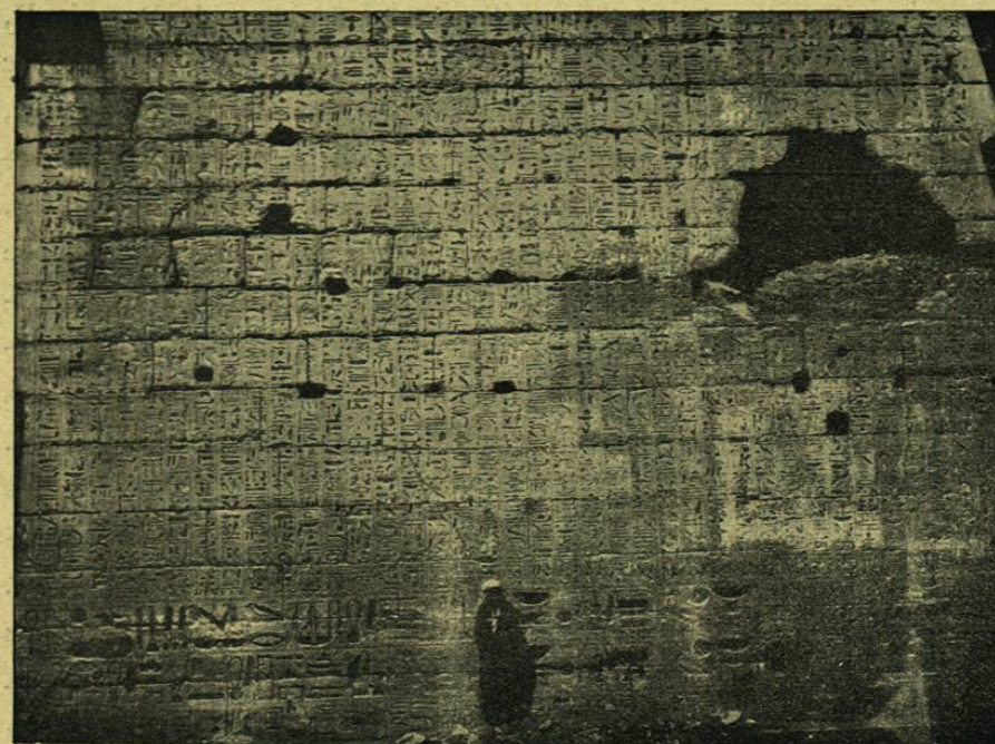
MEDINET HABU, BAJO-RELIEVE DEL GRAN TEMPLO

rables de los antepasados: la mayor parte de los viajeros piadosos hasta pasan la primera catarata para contemplar los colosos augustos del dios rey Amón y de Ramsés, talladas en la roca de arenisca roja en la pendiente de la montaña de Ibsambul. No menos curiosas que los templos y las estatuas son las canteras de granito, de pórfido y de otras rocas donde se ven todavía los colosos y los obeliscos que yacen en tierra esperando el acarreo, ó hasta medio hundidos en la masa de la piedra como si, algunos minutos antes, una brusca llamada hubiera alejado los obreros.