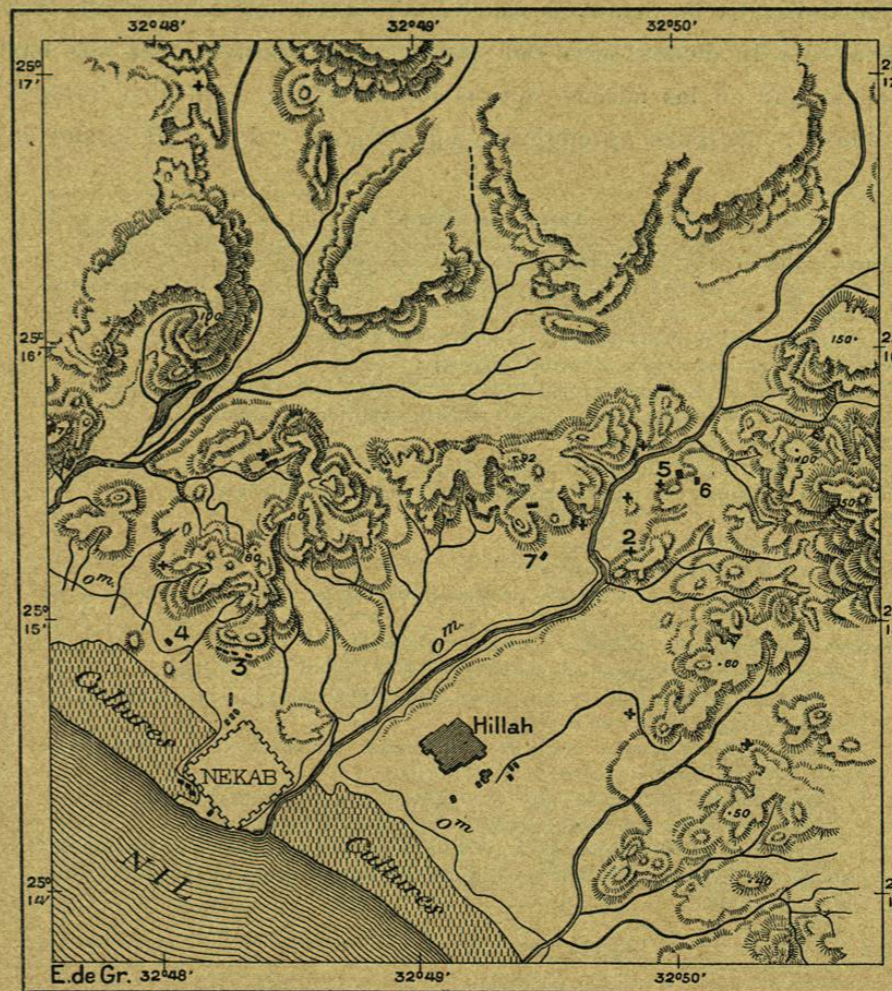
N.º 144. Plano de Nekab (Elkab, Eileithyapolis).