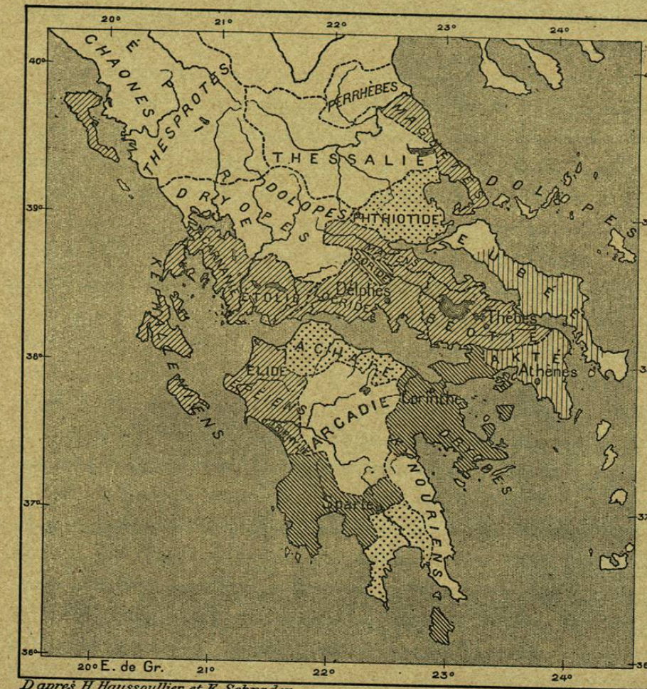
N.º 162. Tribus griegas después de la invasión dórica.

islas de la costa; en el ángulo sud-occidental de la península anatólica nació Halicarnaso, el « fuerte del mar »; Diana vió su templo erigirse en Efeso, ciudad que se hizo conquistadora y adquirió exten-