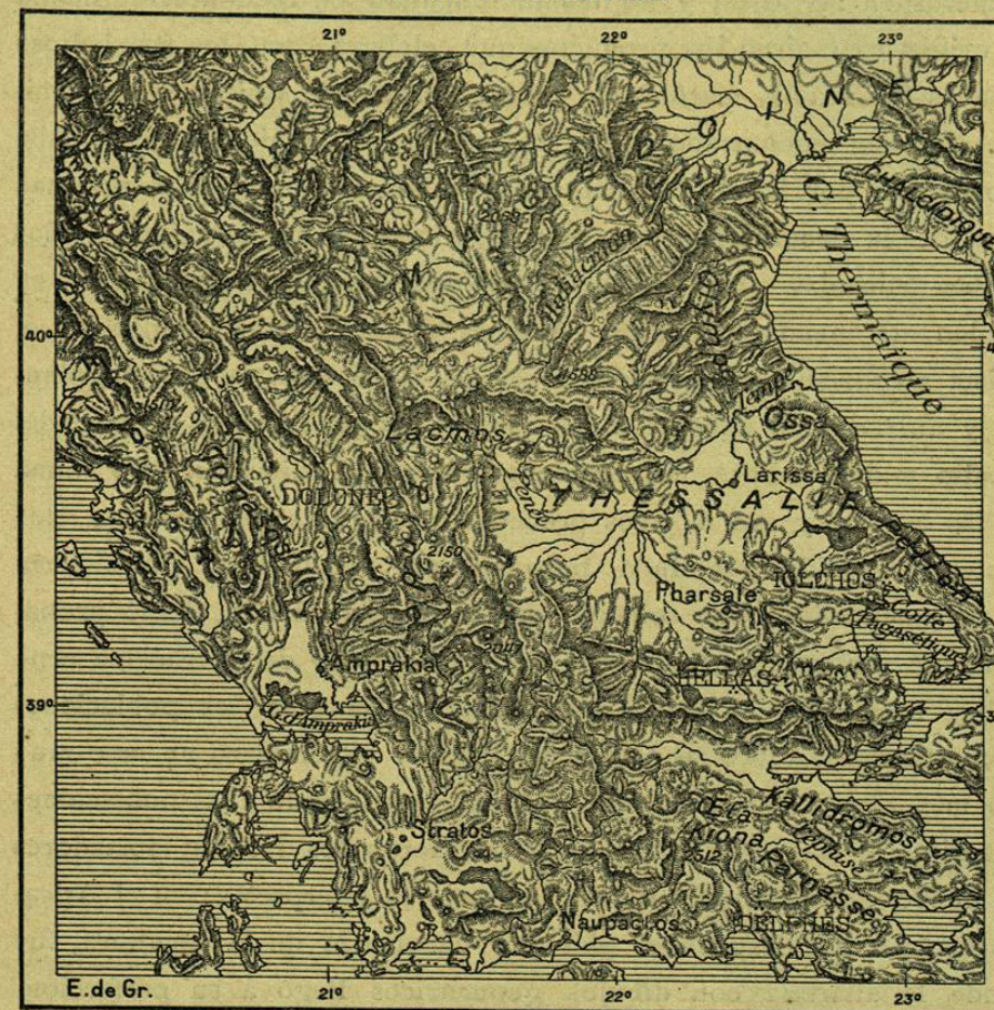
N.º 164. Grecia continental.

que se ocupaban de una labor diferente del cultivo, para el cual son indispensables la fuerza y la salud, se escogían regularmente entre los inválidos y achacosos: el agricultor heleno, lo mismo que en muchas comarcas el campesino francés, decidía que tal hijo raquí-