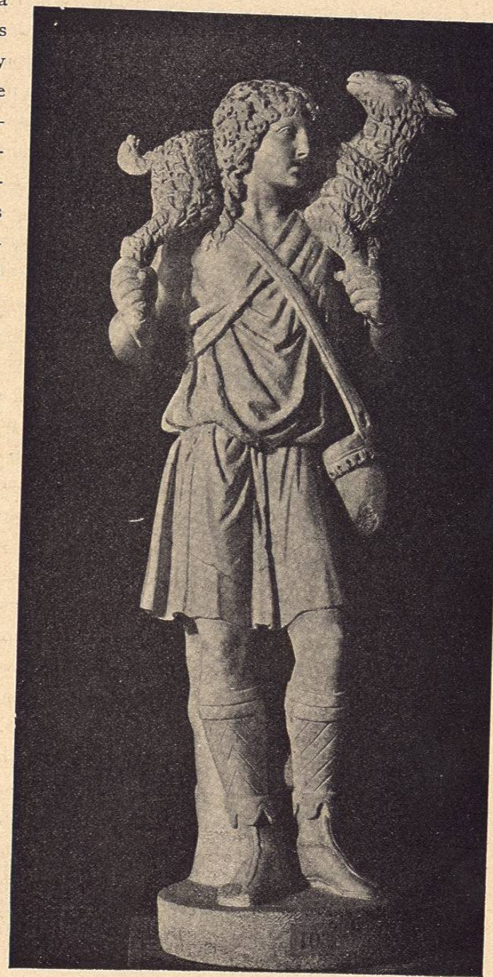
Museo del Louvre.

Del mismo modo todos los conocimientos y refinamientos del espíritu fueron despreciados por los neófitos. La educación de los mismos cristianos era forzosamente pagana, puesto que los que profesaban la «locura de la cruz» eran ignorantes. La escuela quedaba así de una manera indirecta enemiga del cristianismo: contrarió durante