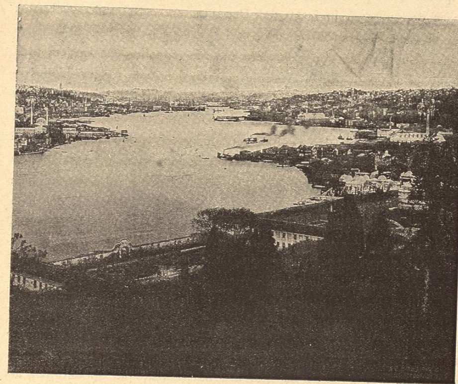
CONSTANTINOPLA — VISTA DEL CUERNO DE ORO

dos actualmente «Puerta de Hierro». No hallando ya camino ni senda, habían de torcer á derecha ó á izquierda, y, de ordinario, procuraban tomar los caminos del Sud, que les conducían hacia las campiñas más fértiles, hacia las ciudades más ricas y populosas, hacia el litoral comerciante del archipiélago. Esta barrera colocada á través de la cuenca fluvial provocaba un remolino perjudicial á los