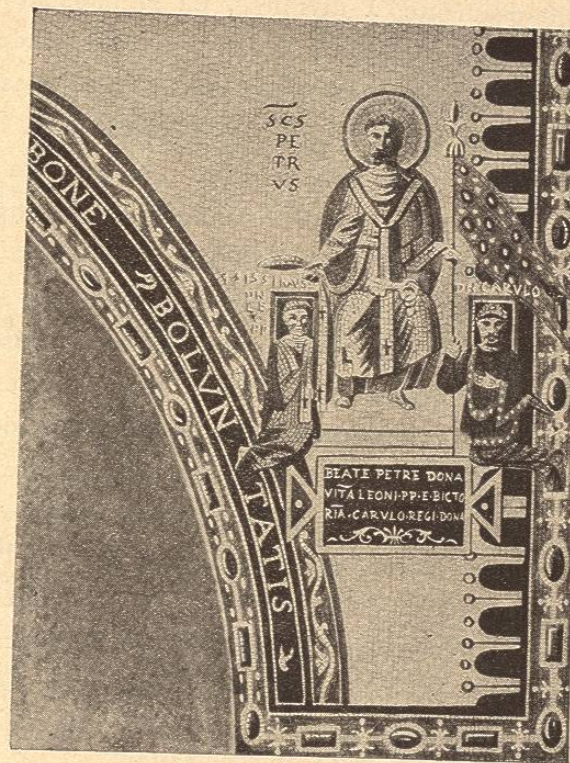
SAN PEDRO ENTREGANDO Á CARLOMAGNO EL ESTANDARTE DE LA CIUDAD DE ROMA Y EL PALIO AL PAPA LEÓN III

irritó contra esas concepciones libertarias que hubieran sustraído á la regla común millones de sus súbditos; como verdadero papa, convocó los concilios, obligó á los obispos y al mismo papa á condenar á Félix, y lanzó contra sus partidarios la furia de los frailes benedictinos de Aniano, que habían confederado todos sus conventos en una misma rigurosa observancia, unida al trono por un pacto de absoluta devoción. En su celo de propaganda religiosa, que en realidad no era sino el culto de su propio poder, Carlomagno hizo construir más de mil iglesias sobre las dos vertientes de los Pirineos, edificios todos consagrados á la Virgen, patrona de las órdenes monásticas. Uno de los numerosos conventos que hizo edificar, el de San Volusiano, cerca de la roca de Foix, fué encargado de vigilar especialmente la diócesis de Urgel, donde Félix había residido como obispo. Tal es el origen de la intervención que el condado de Foix ha tenido siempre desde entonces sobre los habitantes de Andorra, constituídos en república durante el reinado de Luis el Pacífico 1 . El inmenso imperio de Carlomagno, adquirido en parte por la matanza y retenido en su integridad por una política sabia, no por la voluntad de las poblaciones, había necesariamente de fragmen-