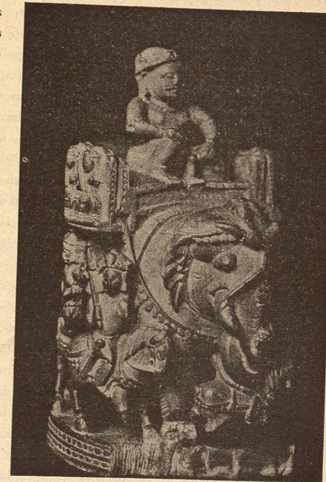
PIEZA DE AJEDREZ PRESENTE DE HARUN-AL-RACHID Á CARLOMAGNO

rio en dos mitades, que antiguamente se comunicaban con dificultad, á causa de los lagos, de los pantanos y de las turberas que ocupaban todas las partes bajas. Esta llanura, cuya más alta arista no pasa de 75 metros, se ramifica al Norte y al Sud por otras depresiones que forman otros tantos estrechos entre los macizos que se elevan á varios centenares y hasta un millar de metros. Hay turberas, pantanos y lagos que dificultan mucho el acceso de esos diversos grupos montañosos, con tanto mayor motivo cuanto que esos extensos espacios intermediarios permanecen por completo deshabitados: hay como gradas que separan los diversos distritos de población, que las vicisitudes de la historia acercaron ó alejaron. Las fronteras de esos