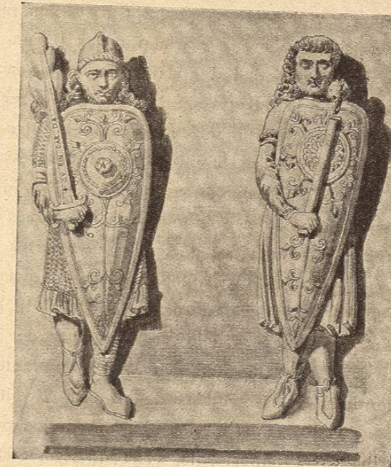
ROLANDO Y ROGER

En Francia se desarrolló casi exclusivamente el ciclo literario de Carlomagno y de sus adalides, siendo un testimonio más de este hecho, que en su conjunto, el reino de Carlomagno representó principalmente el reflujó del mundo latinizado de las Galias contra la barbarie germánica, todavía entregada á la sangrienta epopeya de los Nibelungos, aquellas feroces divinidades de los infiernos, de cuyo poder no se escapa nadie. Pero también en el Norte de Alemania el dios Carlomagno transfiguró el antiguo Wotan, y el personaje de Rolando tomó un relieve extraordinario en las mitologías locales. Las columnas de Irmin , recordando á la vez Hermann ó Arminio, el vencedor de los Romanos, y Donar, el dios del Trueno, fueron consagrados á Rolando, la misma divinidad bajo otro nombre, reemplazando únicamente la maza por una espada 1 .