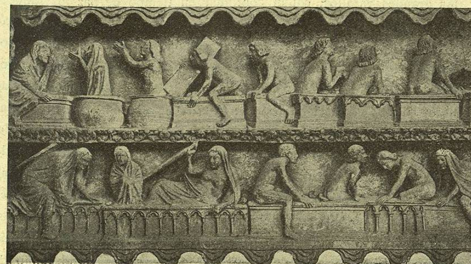
CATEDRAL DE REIMS — LOS MUERTOS SALIENDO DE SUS TUMBAS Fragmento del tímpano de la Puerta del Juicio.

bido de los primeros hombres» 1 . A su vez los poderosos de la Tierra se volvieron contra los pacíficos é hicieron alianza con los malhechores y en todas partes sometieron incondicionalmente á los campesinos. El bandidaje recobró su antiguo esplendor, y «una notable parte de Francia recayó bajo el régimen del terror y de la desolación que era su estado normal».