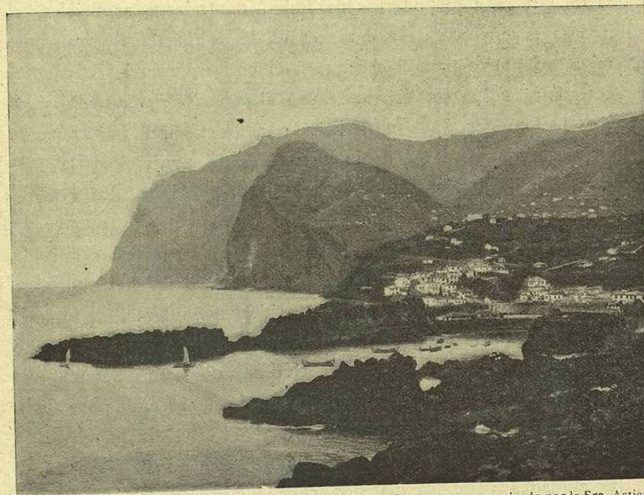
Documento comunicado por la Sra. Astier.

Los Venecianos, aislados en el fondo de su golfo que se abre hacia el Oriente, experimentaron grandes dificultades por el abandono de los antiguos caminos, en tanto que Génova se volvió fácilmente, cuando por el nuevo giro del mundo comercial se vió obligada la navegación á seguir los grandes caminos oceánicos, partiendo de los puertos poco distantes del estrecho de Gibraltar