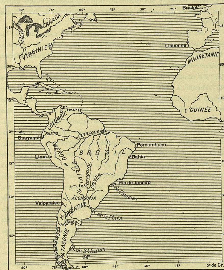
N.º 397. Océano Atlántico.

La escala ecuatorial de este mapa es de 1 á 100 000 000.