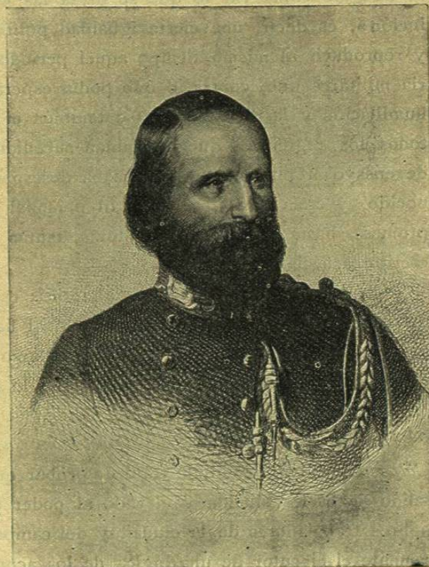
Gabinete de las Estampas.

La obra de la reacción estaba ya terminada y preparaba su código impotente. Francia, que había dado el impulso al movimiento