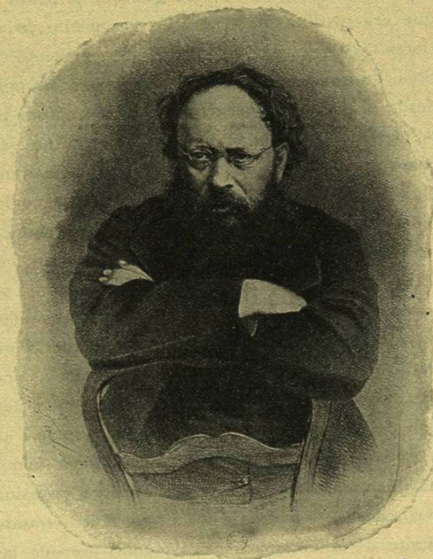
Gabinete de las Estampas.

Felizmente el impulso de libertad fué demasiado enérgico durante el período revolucionario para que fuera posible sofocarlo por completo: la fuerza viva de la actividad humana, irreprimible á pesar de todo, podía ser desviada de su objeto, y canalizada en vías laterales; pero había de manifestarse á pesar de todos los obstáculos y producir cambios considerables. Tal fué la razón por la que la prosperidad material se aumentó casi repentinamente de una manera tan notable en Francia y en toda la Europa continental durante los primeros años marcados por el triunfo de la reacción. A pesar del destierro y de la huida de gran número de republicanos y de la emigración de miles de buenos trabajadores, el movimiento industrial