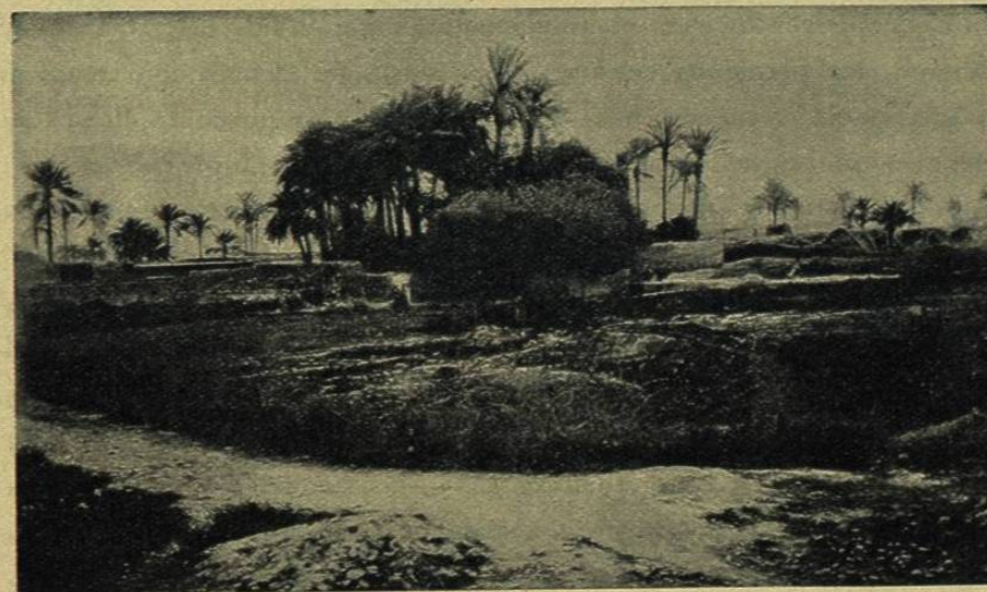
Cl. del Géogr. Journal .

Chosroes. Rusia é Inglaterra son al presente los dos poderes rivales á quienes Persia debe contentar estudiando sus voluntades y sus caprichos y evitando sus cóleras. Nada les hubiera sido más fácil que extender la mano sobre el país y apoderarse de él tranquilamente, si hubieran podido entenderse sobre la línea de las fronteras y si no estuviera sobreentendida cierta obligación de decencia diplomática que impide apresurarse en materia de anexiones. Desde 1430,