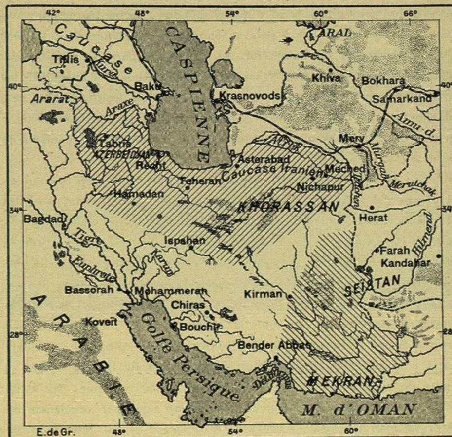
N.º 514. La Persia dividida.

y por el camino de Enzeli y de Recht al Oeste, por el de Meched al Este, realizan todo el movimiento de las mercancías, del mismo modo que si la ocasión se presenta podrán dirigir la marcha de las tropas y la expedición de las piezas de artillería.