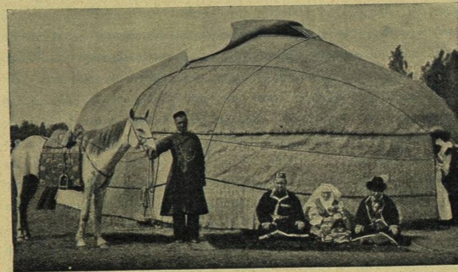
LA «IOURTE» KIRGHIZE Y SUS HABITANTES

La esclavitud ha sido suprimida por efecto de los cambios económicos á continuación de una gran matanza de cautivos, y los piratas no visitan ya en cuadrillas la meseta del Irán, hasta más allá del Meched, para capturar allí pacíficos labradores. La población aumenta de nuevo en aquellas comarcas que una especie de consentimiento general considera, con razón ó sin ella, como la cuna del mundo y que los dominadores sucesivos habían casi despoblado. La paz entre