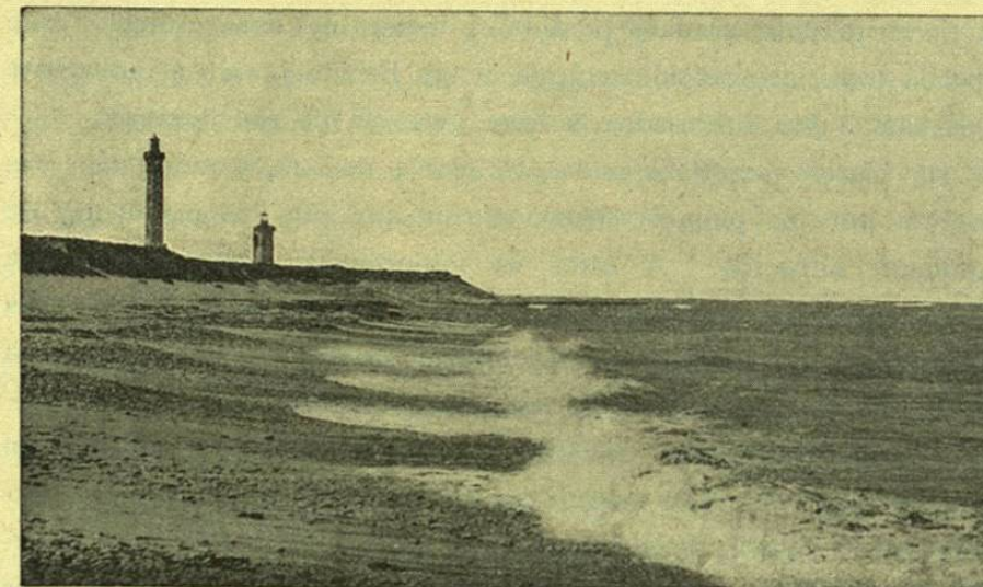
LA COSTA DE LA ISLA DE RE INMEDIATA Á LA PUNTA DE LAS BALLENAS Y Á LOS PANTANOS PERDIDOS

Los trabajos más urgentes no pueden hacerse porque la fuerza de inercia de las oficinas permanece invencible. Tal es el ejemplo de la isla de Re, que está en peligro de ser algún día cortada en dos por una tempestad. Del lado del Océano ya ha perdido una orilla