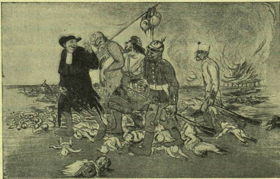
Cl. de l'Assiette au Beurre.

Francia, tomada como ejemplo de esta «democratización» del Estado, está dirigida por un número de unos seiscientos mil parti-