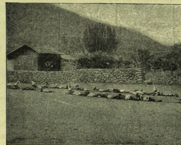
Cl. del Globus .