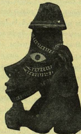
FIGURA DE DIOS EN LA POPA DE UNA CANOA MELANESIA

Por su esencia misma, las religiones, incluso el catolicismo que se dice «flexible» porque se esfuerza en dominar los caracteres, van retrasadas en su evolución. Abrumadas por su enorme bagaje de supervivencias de los tiempos inmemoriales, obligadas á atenerse á las antiguas fórmulas para justificar su pretensión á la infalibilidad, dejándose adelantarse siempre por las conquistas de la ciencia, se dedican fatalmente á combatir ante todo lo que cien años después se verán obligadas á admitir tácitamente ó hasta predicar. De tal manera forman la retaguardia de las naciones modernas, que hasta rehusan aceptar las nuevas situaciones que podrían serles útiles. Así es como el Papado, forzado por los poderes