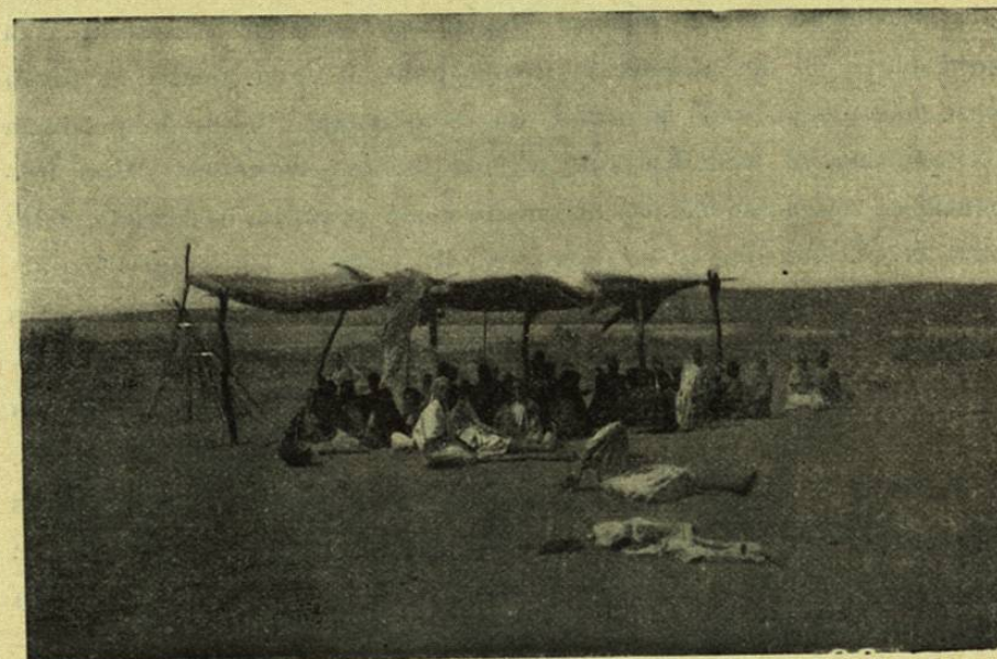
Cl. L. Cuisinier.

lizados se hace en gran parte — lo que no siempre es un progreso — por medios artificiales. Además disminuye, y debe forzosamente disminuir, el número de hijos, por haber reducido la higiene la cifra de la mortalidad en todas las comarcas de Europa y países que gravitan en su rededor. Todavía en el siglo XVIII se podía esperar la muerte para la mayoría de los recién nacidos; en nuestros días la mayor parte de