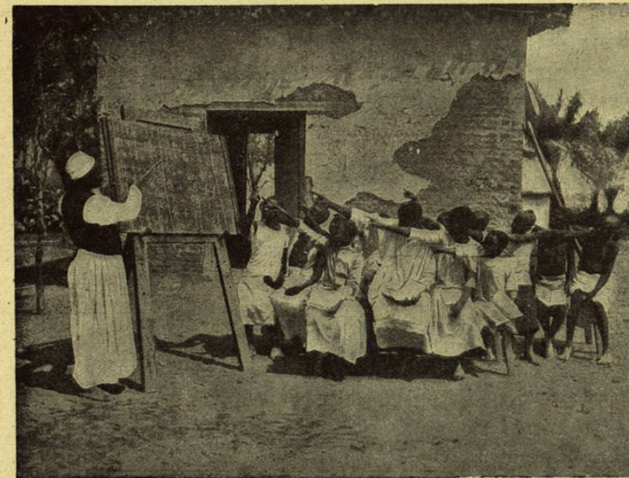
UNA ESCUELA NEGRA

los niños y á las que se refieren el arte de la escritura y de la lectura; por último, el canto, la danza, la mímica, las bellas actitudes rítmicas, tal es el conjunto de las ocupaciones que deben preparar el niño á la serie de los estudios ulteriores destinados á hacer de él un hombre. Añádase lo que se puede aprender de matemáticas trazando figuras sobre la arena, porque la geometría