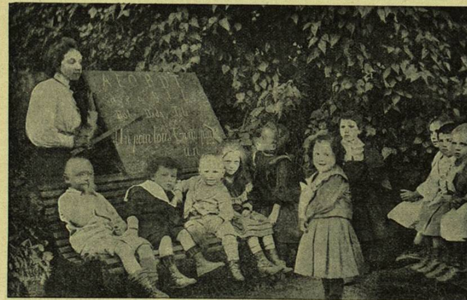
Cl. de l'Avenir Social.

causan con predilección sus víctimas en las falanges de la indigencia. Además, contra los pobres se ceba con más energía la casta de los curadores de toda clase, con patente ó sin ella, médicos, cirujanos, curanderos, charlatanes, que tienen interés directo en perpetuar la enfermedad, en crearla, en caso necesario. En el actual estado social, es siempre peligrosa la existencia de una contradicción entre