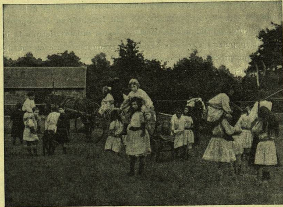
Cl. de la Ruche.

han formado en cada centro urbano el triste cuadro de la mortalidad según el estado de fortuna de las clases: la proporción varía del sencillo al doble, al triple, al séxtuplo. Aquí los pastores que predicán la resignación á los humildes de sus rebaños; allá el rebaño mismo que marcha en multitud como al matadero. Las gentes de la clase rica sobreviven á las condiciones más contrarias á una buena salud;