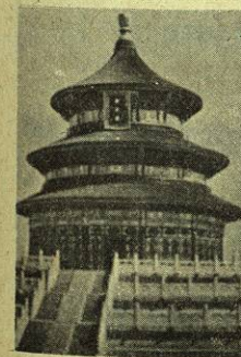
Templo del Cielo. Pekín, China.

Es el último esfuerzo, procura poner todo el empeño - que te sea posible.