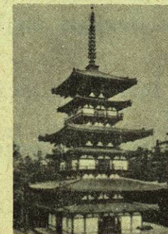
Torre de Yabusaki. Japón.