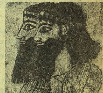
Pintura mural. Palacio asirio de Tel Barsib.