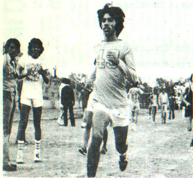
Con un evento a campo traviesa, se iniciarán hoy las actividades deportivas de la UANL, en la que participarán hombres y mujeres. En esta foto de archivo se aprecia a dos atletas de la UANL, en reciente evento deportivo.