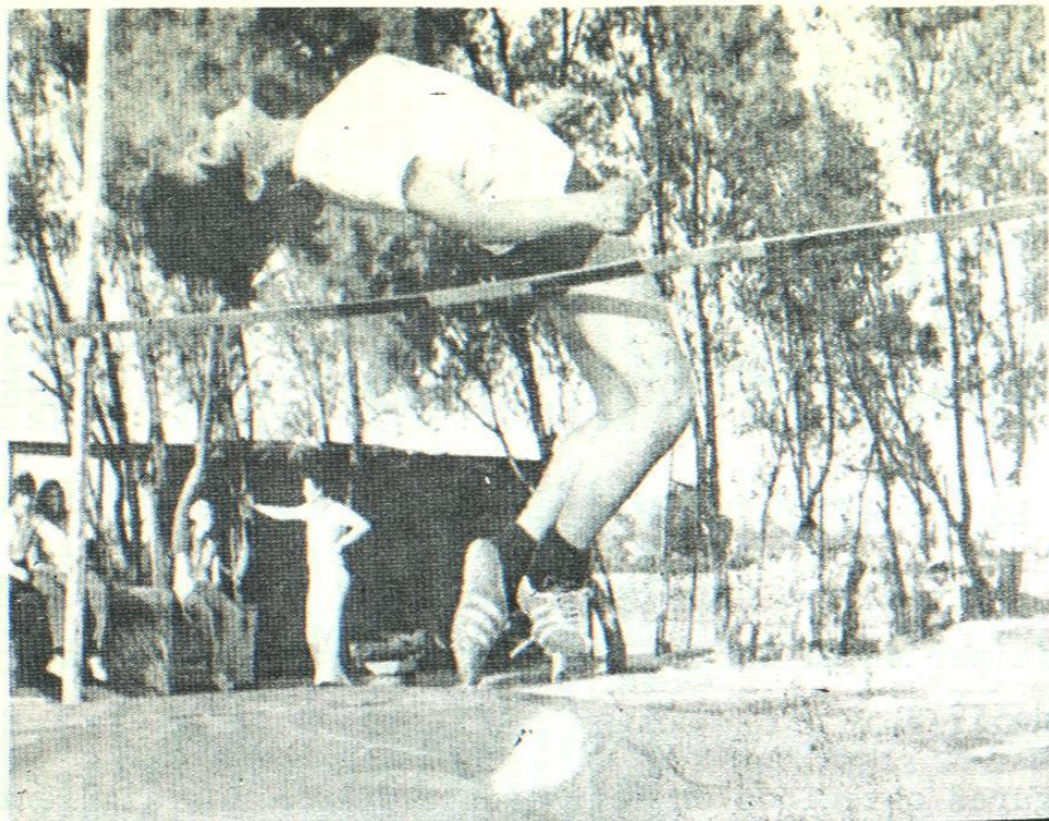
Los atletas de la Facultad de Odontología y de Organización Deportiva (ELOD) de la UANL, competirán a partir del lunes 26 y hasta el viernes 30, en Torneos Relámpagos donde los universitarios honrarán a destacados deportistas designados "Motivadores del Deporte".