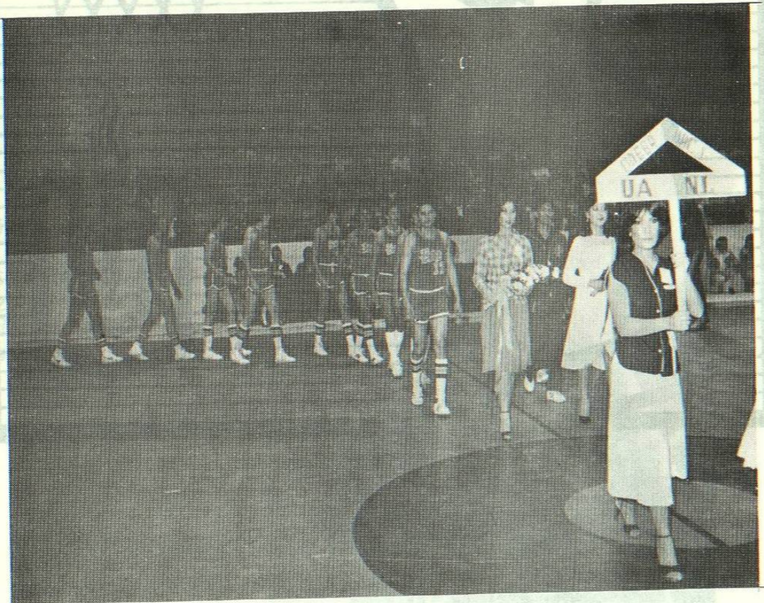
Durante la ceremonia de Inauguración del Campeonato Nacional Estudiantil de 1981 en Cd. Juárez, Chih. Los Tigres hicieron su presentación defendiendo los colores de la U.A.N.L.