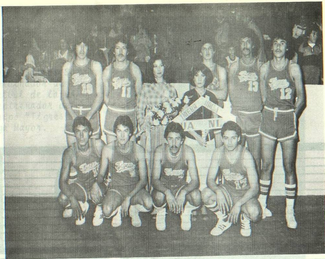
Los Tigres estuvieron presentes en Cd. Juárez, Chih. donde obtuvieron el cuarto lugar del Campeonato Nacional Estudiantil en Enero de 1981, dejando una grata impresión entre el público asistente.