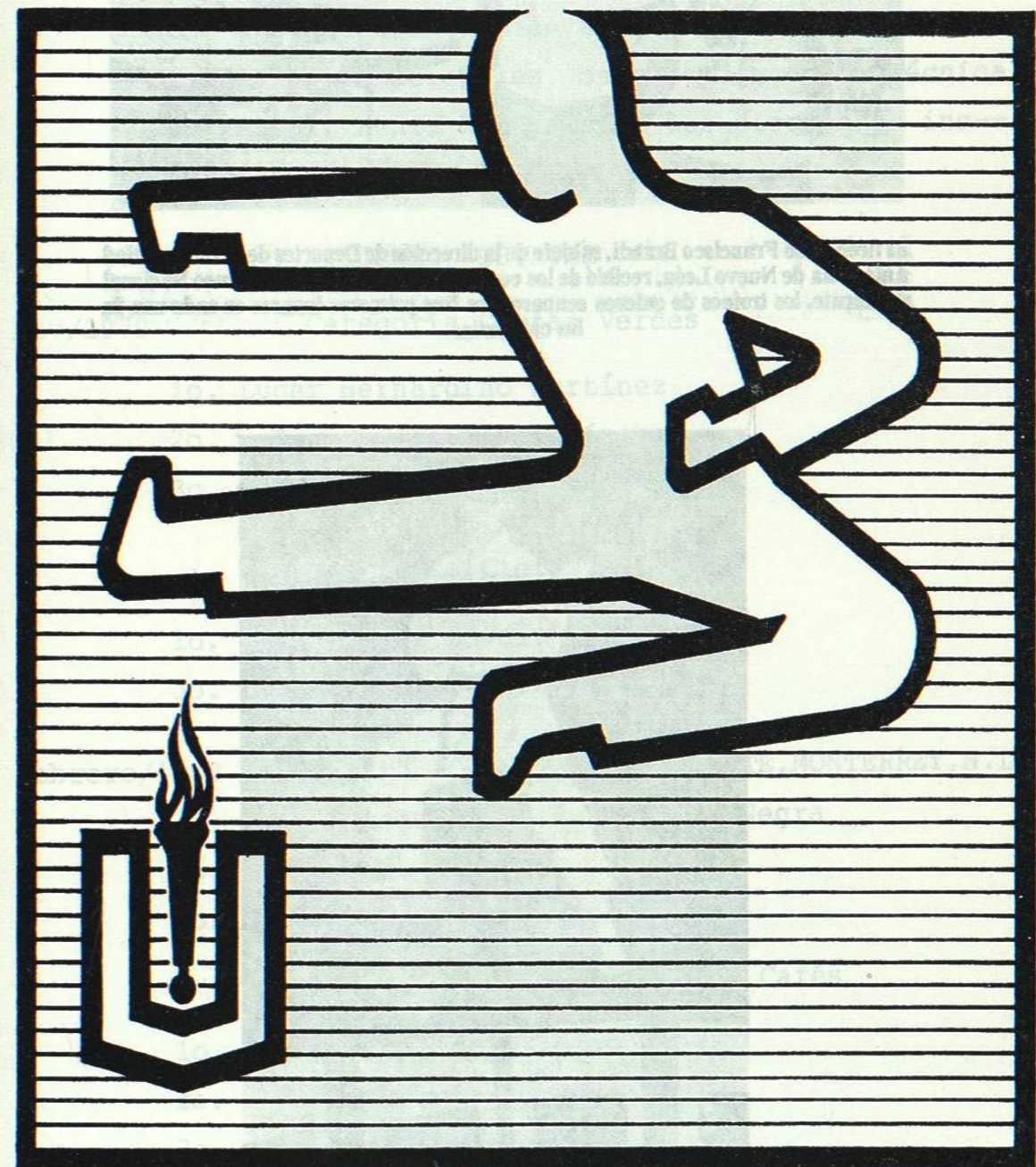
El equipo representativo de León, ha estado promoviendo esta disciplina en la U.A.N.L., de acuerdo a la programación de la Dirección General de Deportes.