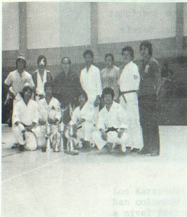
Equipo de la U.A.N.L. Posando con los Trofeos conquistados en el Campeonato Nacional Estudiantil efectuado en Guajalajara.