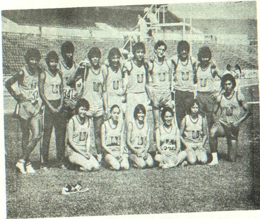
EL EQUIPO de Atletismo de los Tigrillos de la Universidad de Nuevo León, siendo el tercer mejor conjunto a nivel Nacional, durante el año de 1982, logrando buenas victorias en los diferentes eventos locales y nacionales.