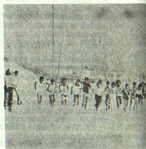
Con un total de 30 competidores, se llevó a cabo ayer la carrera de campo traviesa, organizada por la dirección de deportes en conjunto con la coordinación de atletismo de la UANL, para prepas y facultades.