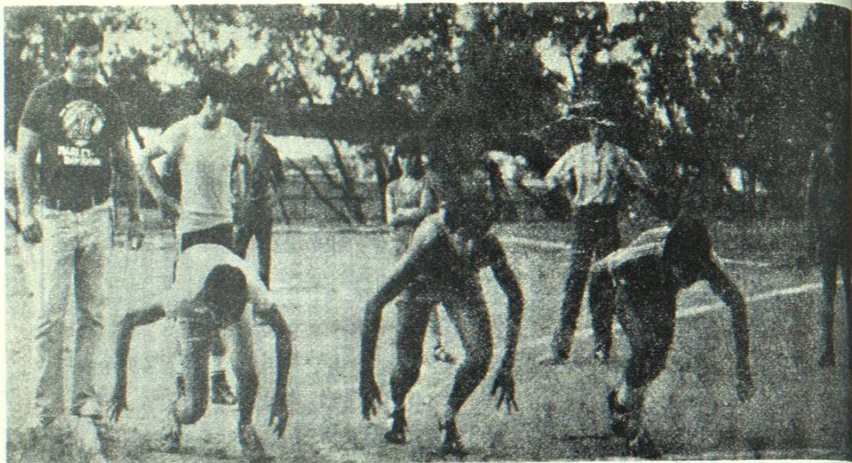
En busca del triunfo salen los universitarios dentro de la penúltima etapa del torneo Intrauniversitario de atletismo.