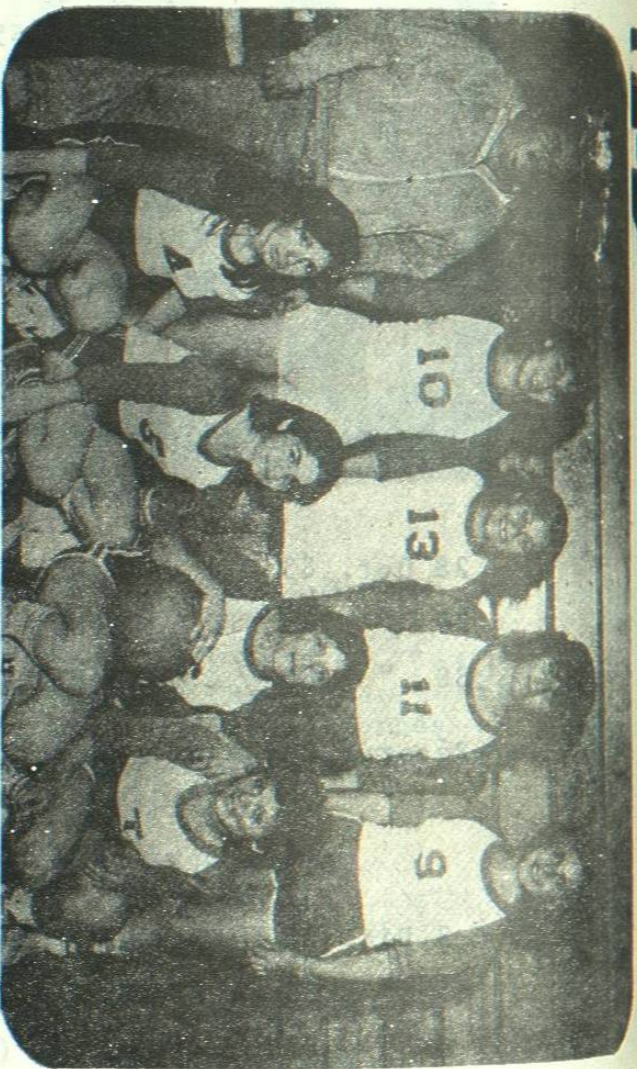
Equipo de basquetbol de la Universidad Autónoma de Nuevo León que es la rama femenil destacó en la pasada Universiada Nuevo León 400.

Monterrey, N.L., Jueves 21 de Abril de 1983