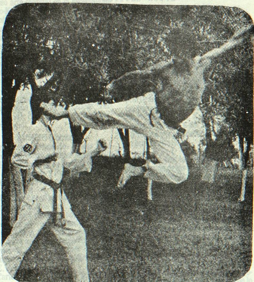
A TRAVES de muchos años, el karate en la Universidad Autónoma de Nuevo León ha sido uno de los deportes de más arraigo. Proximamente celebrarán un aniversario más en el Club CIMA.

Los interesados que deseen asistir a la Cena reunión del próximo 7 de Marzo en el Club Cima, pueden solicitar mayor información a los teléfonos 52-39-95; 59-14-39 y 44-09-20 o acudir a la Dirección General de Deportes.