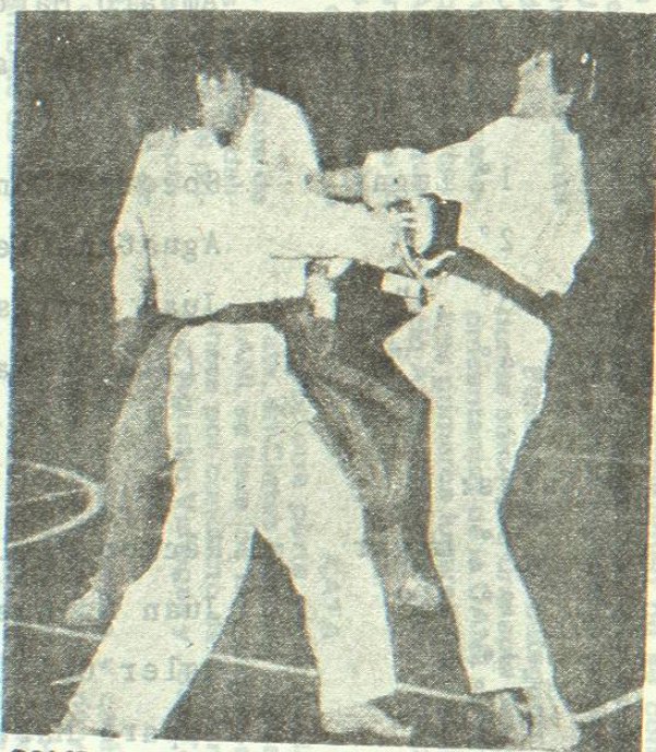
COMBATES FEMENILES de la III Universiada Nuevo León 400 le dieron la corona de la UANL con su equipo "A", tanto en femenil como en la varonil.