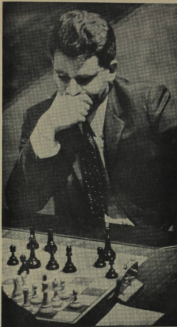
BORIS SPASSKI, X Campeón Mundial de Ajedrez