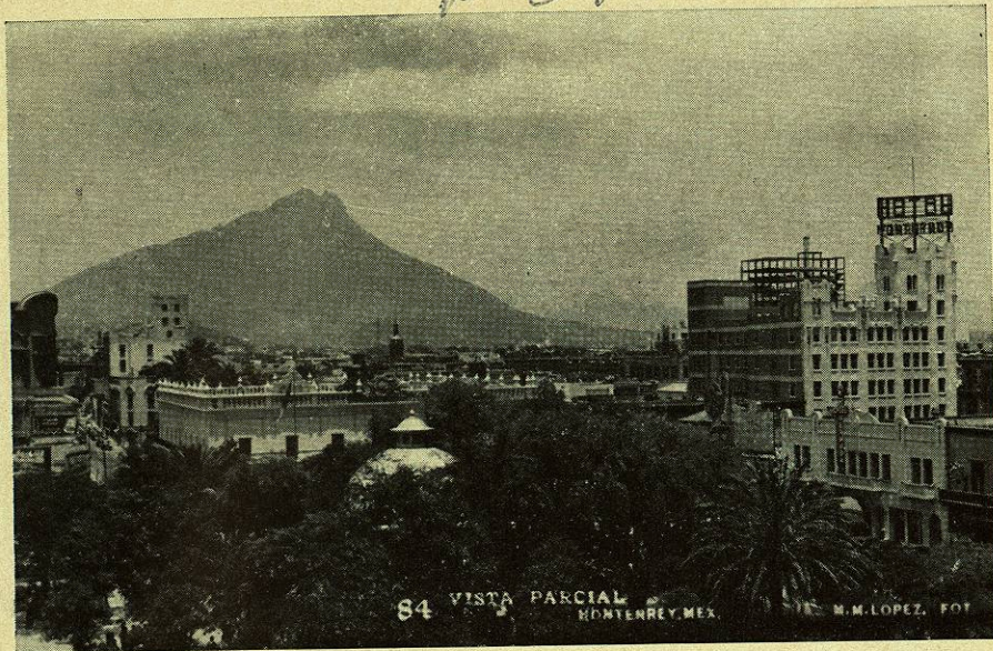
Vista parcial de la capital del Estado de Nuevo León, sede del Séptimo Congreso Nacional de Sociología.