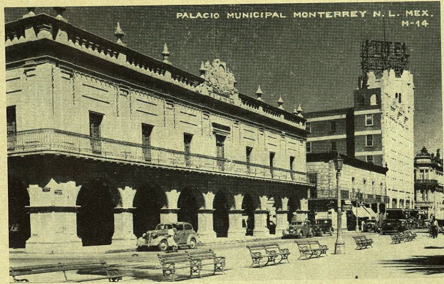
Palacio Municipal de la ciudad de Monterrey, N. L., situado en uno de los costados de la plaza principal de la ciudad que alojó al Congreso Mexicano de Sociología Urbana.